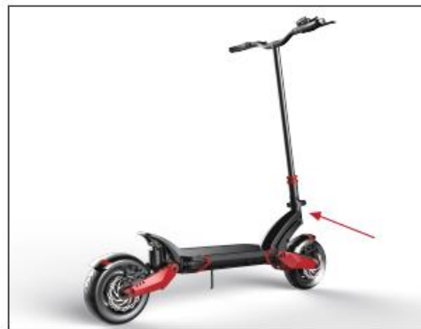
Step 2: unlock the clamp