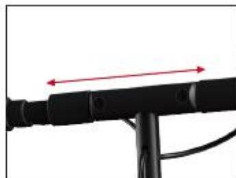
Step 2: extend the T-shaped sleeve outward