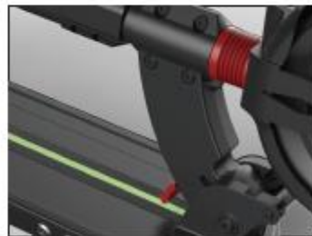
Step 6: push forward and at the same time hold down the lever when folding the head.