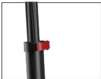
Step 4: unscrew the nut