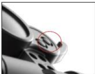
Step 1: power on