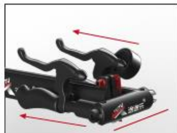
Step 3: bend the handle downward