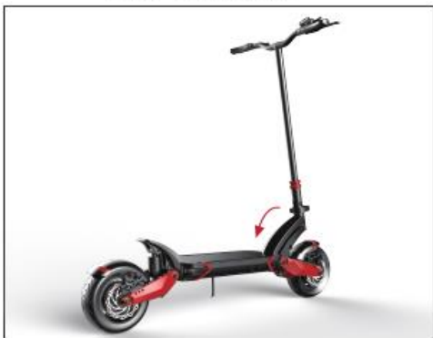
Step 3: put down the main rod