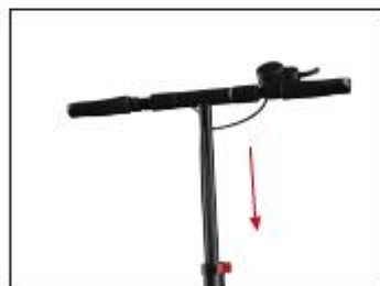
Step 5: adjust T-shaped tube downward