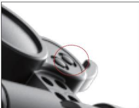
Step 1: power on